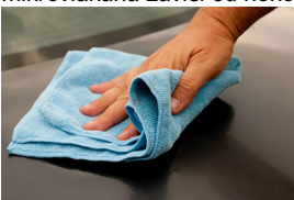
Upotreba tkanine od mikrovlakana:

Krpe i krpe za ?i?enje od mikrovlakana dobro deluju za uklanjanje organskih materija (prljavština, ulja, masnoc?e) kao i klica sa površina. Sposobnost ?i?enja mikrovlakana rezultat je dve jednostavne stvari: vec?e površine i pozitivnog naelektrisanja. Krpe od mikrovlakana mogu se koristiti mokre ili suve na bilo kojoj površini u vašem domu. Uparite krpe od mikrovlakana sa dezinfekcionim sredstvima ili drugim rastvara?ima po želji. U idealnom slu?aju, krpe od mikrovlakana treba prati nakon svake upotrebe da biste uklonili prljavštinu i masnoc?u pokupljenu tokom ?i?enja kako ne biste preneli prljavštinu na sledec?u površinu. Prema istraživanjima proizvo?a?a krpa od mikrovlakana, prose?na krpa od mikrovlakana može trajati do 5 godina ako se pere 25 puta godišnje. Na kraju krajeva, dugove?nost vaših krpica od mikrovlakana zavisi od nekoliko faktora kao što su koliko ?esto ih koristite, za šta ih koristite i koliko dobro se brinete o njima.